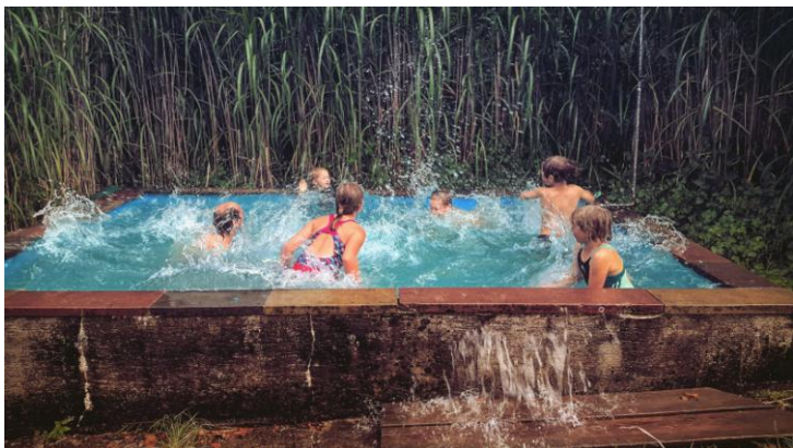
Badeplausch, Freizeitgelände Stutz Therwil

IOGT Basel | 2/2017 | Juni – September 2017