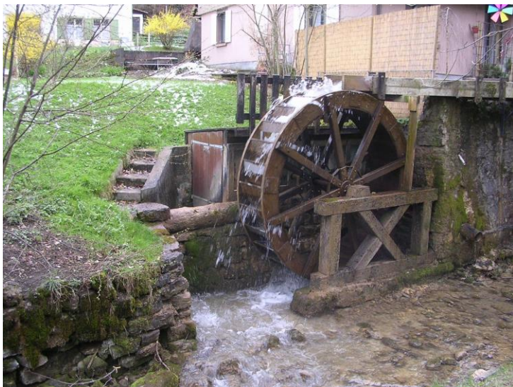
Kleinwasserkraftwerk an der Hinteren Frenke bei Reigoldswil; Foto: Cekora/pixelio.de

IOGT Basel | 1/2019 | Februar bis Mai 2019