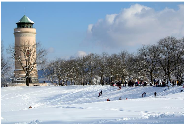
Wasserturm auf dem Basler Bruderholz

IOGT Basel | 3/2018 | Okt. 2018 bis Jan. 2019